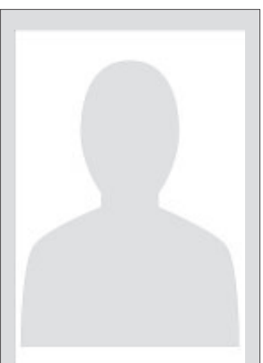
ЛУЧИНСКАЯ Алла Михайловна